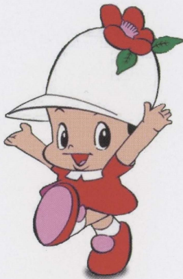
船橋市民のシンボル さざんかさっちゃん

未来を担う青少年健全育成を目的として誕生した地域基金「さざんかさっちゃん教育基金」は、募金運動を地域で興し、集まったご厚志・浄財を「基金(ファンド)」として、運用益を地域の為に有効に使うというものです。