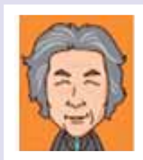
小泉純一郎 横須賀 JC 第 87-89 代総理大臣

上記の他にも……チャールズ・リンドバーグ氏（アメリカ合衆国、飛行家）やアメリカの歴代大統領（第 40 代レーガン氏、第 42 代ビル・クリントン氏）、ジャック・ルネ・シラク氏（フランス、元大統領）や、日本の歴代総理大臣などがいらっしゃいます。