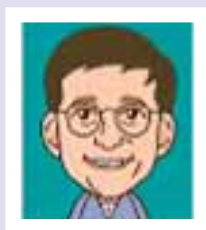
ビル・ゲイツ アメリカ合衆国 マイクロソフト創業者