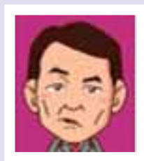
麻生太郎 飯塚 JC、日本 JC 元会頭 第 92 代総理大臣