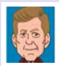
ジョン・F・ケネディ アメリカ合衆国