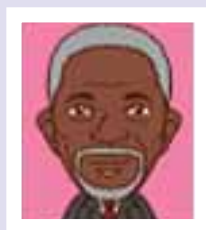
コフィー・アン ガーナ共和国 元国際連合事務