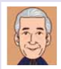
千玄室 京都 JC、日本 JC 元会頭 茶道裏千家前家元